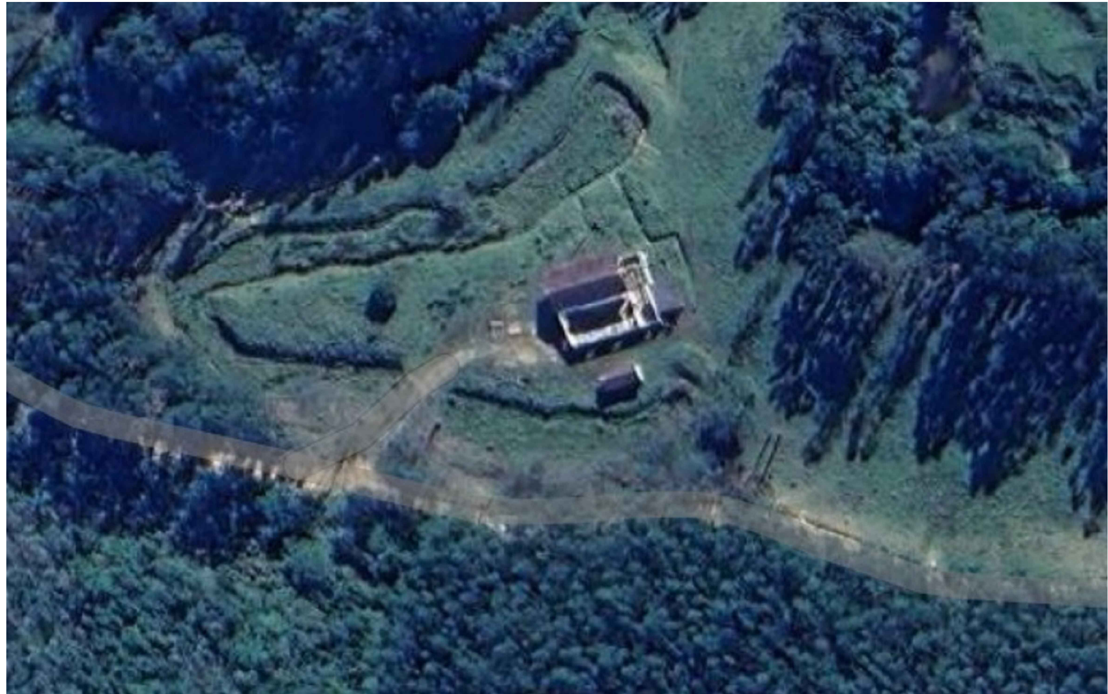
LOCALIZAÇÃO S/ Esc.